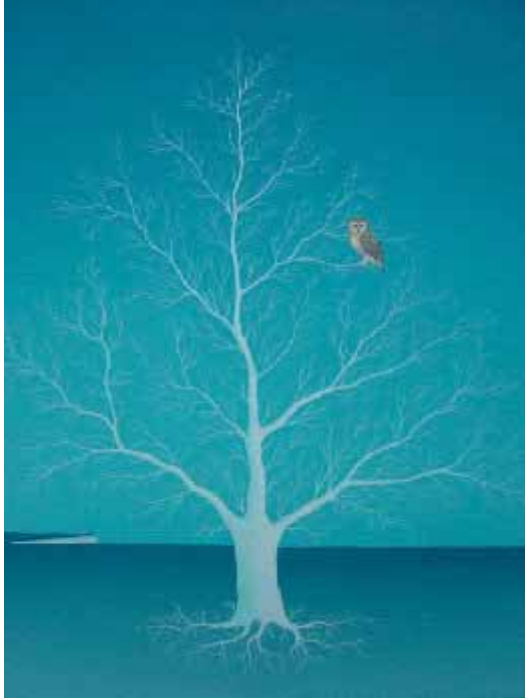
„Schleiereule“ 45x50 cm