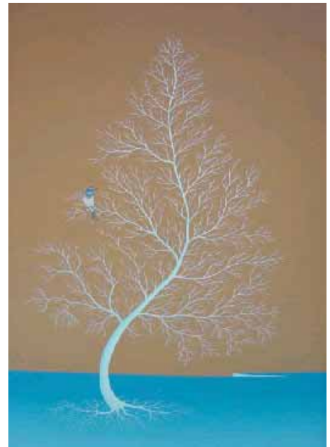
„Blaukehlchen“ 40x60 cm