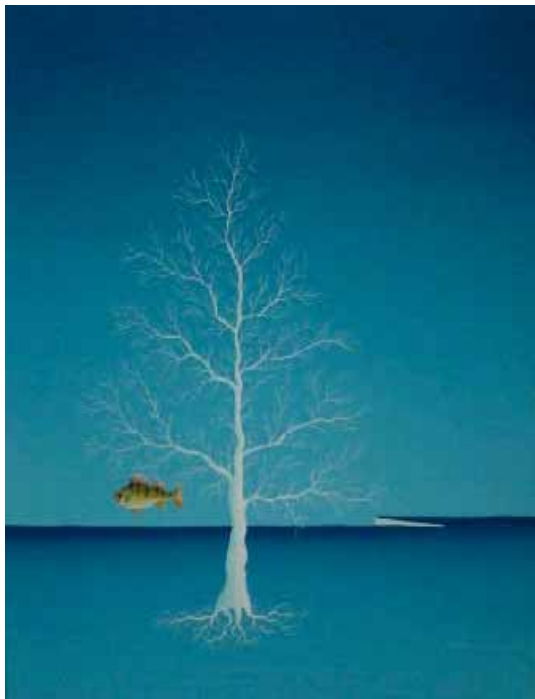
„Flussbarsch“ 45x50 cm