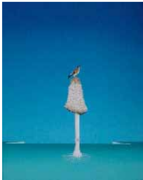
„Stieglitz“ 50x60 cm