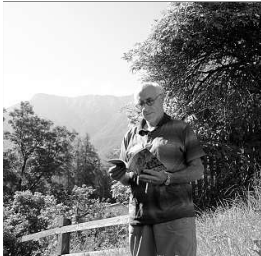
Cla Rauch da la cumischiun da la senda dal Quar legia seis cudesch.